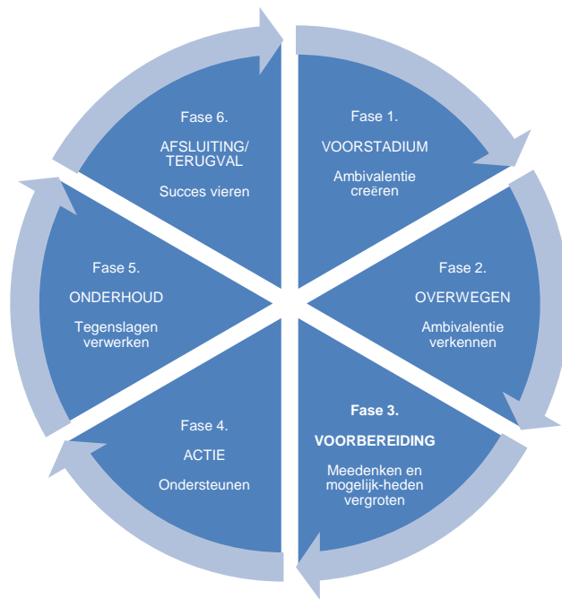
Figuur 1. Fasen van gedragsverandering 3

Motivatie is geen vaststaand persoonskenmerk. Het is te zien als een momentopname en kan beïnvloed worden door de relatie tussen hulpvrager en ondersteuner. Ook tijdens het zoeken naar de juiste aanpak kan het nodig zijn om af en toe terug te vallen op het 'waarom' van de verandering. De ondersteuner stuurt de hulpvrager in deze zoektocht, herkent in welke fase een hulpvrager zit en speelt daarop in.